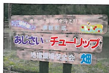
地福環境保全会（地福）