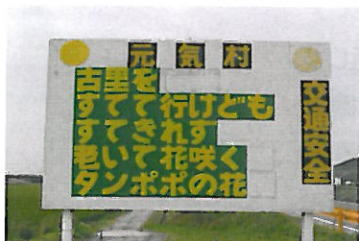
元気村二島東（二島）