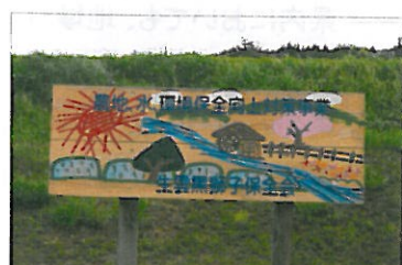
生雲黒獅子保全会（生雲）