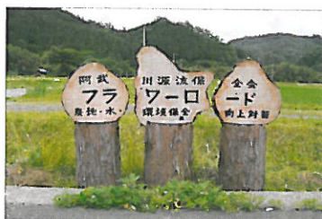
阿武川源流保全会（嘉年）