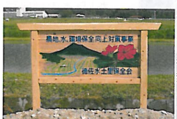
徳佐水土里保全会②（徳佐）