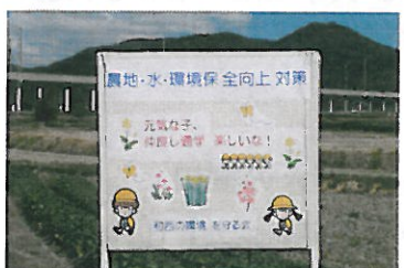
和西の環境を守る会（銚銭司）