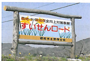
徳佐水土里保全会①（徳佐）