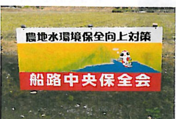
船路中央保全会（徳地）