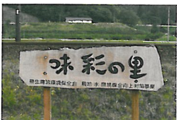
篠生清流環境保全会（篠生）