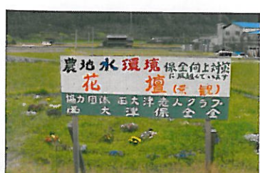
西大津保全会（徳地）