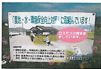
中恋路環境保全クラブ（宮野）

地域住民の理解を深めるために、私たちは、こんな看板を設置しています！（山口支部）