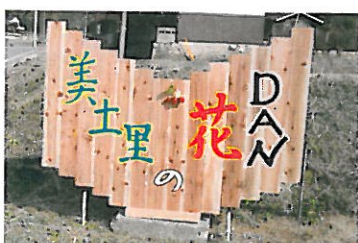
水土里を守る会（小鯖）