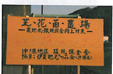
沖ノ原地区環境保全会（徳地）